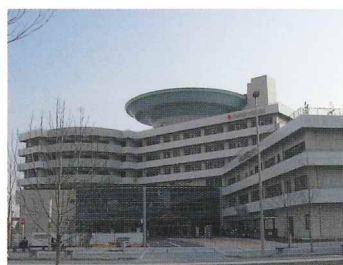
神戸赤十字病院 兵庫県災害医療センター