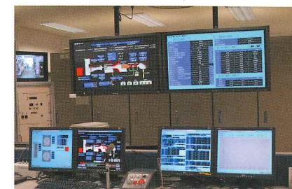
制御計測配線工事