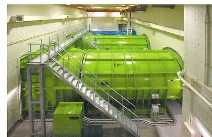
換気設備電気工事