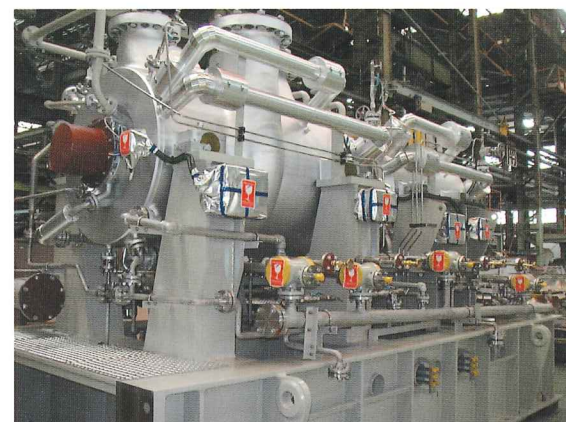
各種ユニット電気計装工事

トンネル換気、電気集塵機、風洞設備、天然ガス圧送プラント、海外向けプラントなどあらゆる設備の制御並びに計測配線工事、計装工事、機器据付工事の設計、施工と監理業務。低周波・高周波誘導炉設備、誘導加熱設備等の据付配管配線工事。