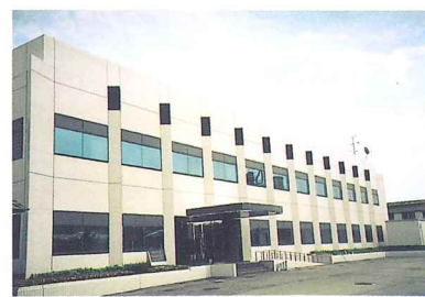
神戸検疫所輸入食品検査センター