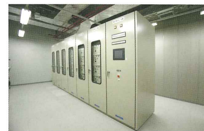
制御盤等搬入・据付工事