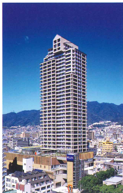
ウェルブ六甲道1番街