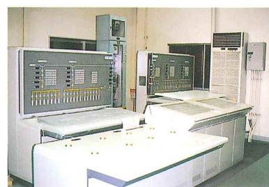
神戸市土砂運搬設備電気室