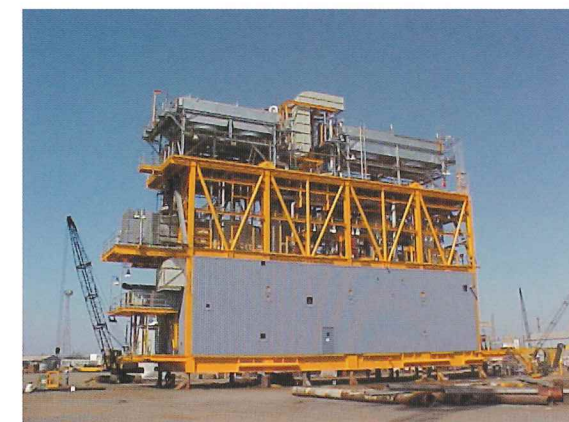
天然ガス圧送モジュール電気計装工事