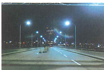
ハーバーハイウェイ