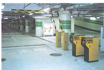
神戸市立ハーバーランド駐車場