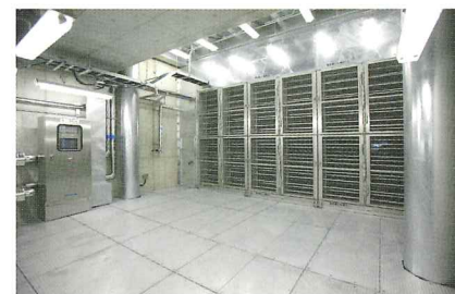
電気集塵機設備工事