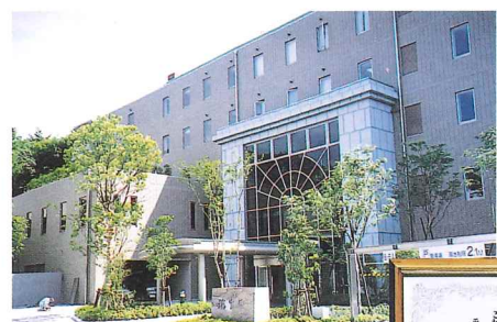
有馬保養所「瑞宝園」

兵庫県は、心豊かな兵庫をめざし、広大な県土を舞台に「ゆとりとうるおいに満ちたさわやかな県土づくり」に取り組んでいる。この運動の柱となるのが、県土の基盤整備。平成2年度から始まった「さわやか県土づくり賞」は、こうした数多くの実施事業の中から、高度な技術力を発揮し、優良な建設工事を施工した業者に対して贈られる。