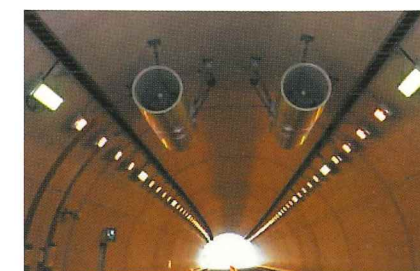
ジェットファン据付・配線工事