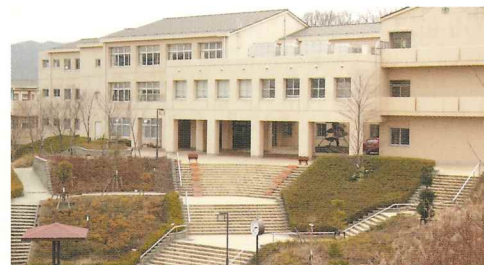
神戸市立桂木小学校