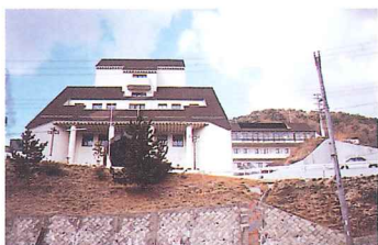
兵庫県立光風病院