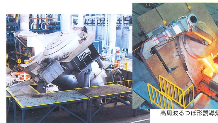
高周波るつぼ形誘導炉

ガスタービン、蒸気タービン、船用ディーゼルエンジン、多段コンプレッサ、ブロワなどの機側配線工事及び計装工事の設計並びに施工。